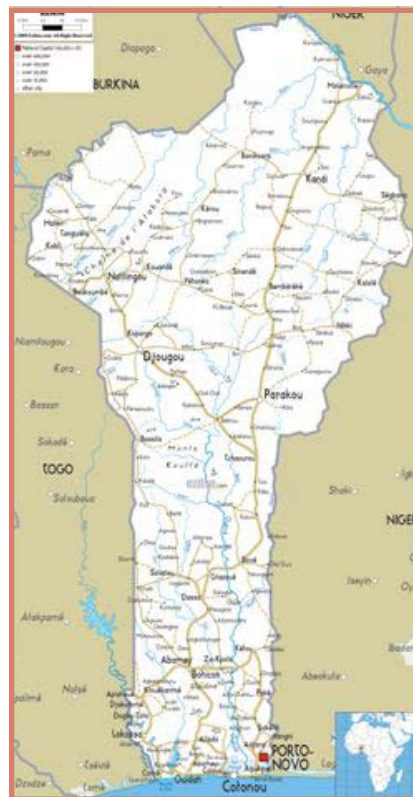
Foto: Mapa de Benín, África